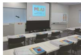
MLAJ 横浜セミナールーム