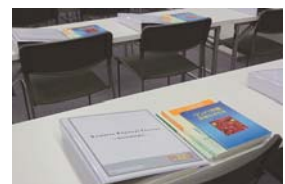
MLAJ 講習会ファイル（左）

※ キャンセルについて・・・キャンセル料は指定された入金締切日より受講の前日までが受講料の半額、当日以降は全額です。ご不明な点はMLAJ事務局までお問い合わせください。