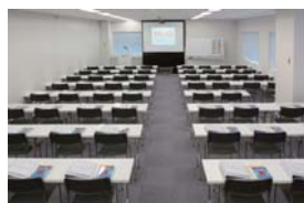
MLAJ 横浜セミナールーム