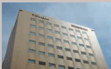
[横浜会場] 日本医療リンパドレナージ協会 横浜セミナールーム (横浜市中区)