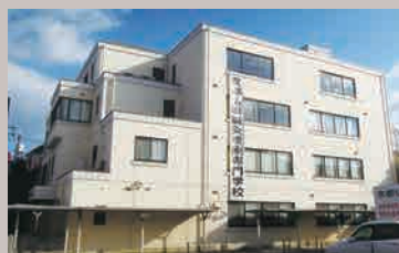
[京都会場] 京都仏眼鍼灸治療専門学校 (京都市東山区)